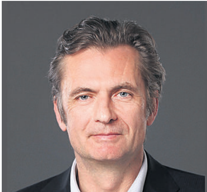
Christian Wenaweser spricht über die Gerichtsbarkeit des Internationalen Strafgerichtshofs bei Cyberangriffen.

Seit dem 17. Juli 2018 hat der Internationale Strafgerichtshof (ICC) die Kompetenz, politische oder militärische Führungspersonen für völkerrechtswidrigen Gewalteinsatz zur Rechenschaft zu ziehen. Dies ist eine der wichtigsten jüngsten Entwicklungen im Völkerstrafrecht, zu welcher Liechtenstein massgeblich beigetragen hat. In einem allgemeinen Klima der Schwächung internationaler Normen hat die Kriminalisierung solcher Aggressionsverbrechen jedoch