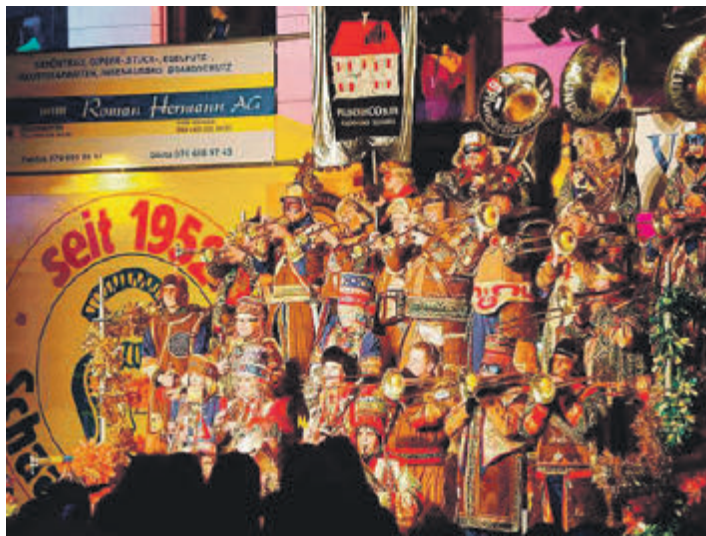
Die Plunderhüüslers landen an diesem Samstag zum traditionellen Schaabumm ins Schaaner Zentrum ein.

Zahlreiche Guggamusiken aus dem In- und Ausland werden ihr Können beweisen. Der Event startet mit dem Monsterkonzert. Dieses findet im überdachten Lindahof statt – schlechtes Wetter ist daher kein Grund, dem Schaabumm fernzubleiben. Die Plunderhüüslers werden ihr Monsterkonzert um 17 Uhr eröffnen und die neuen Lieder sowie das diesjährige Motto «Flora's Werk» präsentieren. Es folgen acht Gast-