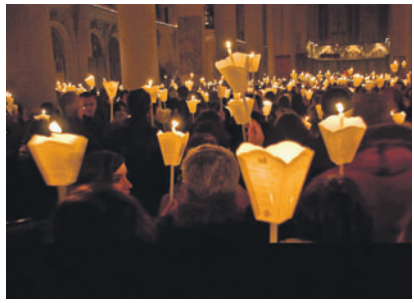
Die Kerzensegnung beginnt am kommenden Sonntag um 18 Uhr.

ESCHEN Am kommenden Sonntag, den 2. Februar, findet um 18 Uhr in der Pfarrkirche Eschen eine grosse Kerzenweihe mit anschliessender Licherprozession statt. Alle Besucher können zu weihende Kerzen mitbringen und vor die Weihnachtskrippe legen. Pater Philipp Karasch aus dem Wiener Oratorium wird die